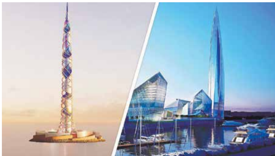
НА ФОТО: ПРОЕКТ НОВОСТРОЙКИ ОТ ГАЗПРОМА (СЛЕВА). ПЕРВАЯ БАШНЯ «ГАЗПРОМА» НА БЕРЕГУ ФИНСКОГО ЗАЛИВА (СПРАВА).

Ещё одной супербашней готовится осчастливить Петербург «Газпром». Первая, высотой 462 м, воздвигнута в курортной зоне в Лахте, на берегу Финского залива. Она стала самым высоким зданием в Европе. И самым дорогим сооружением в мире: обошлась за годы строительства (с 2012-го) по официальным данным на 2018-й год в 2,5 млрд долларов.