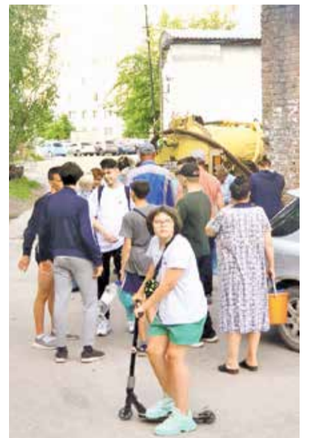
НА ФОТО: ОЧЕРЕДЬ ЗА ВОДОЙ

От аварий водопровода страдают и другие части города. На улице Береговой трубы прорывает с завидной регулярностью, при этом организацию подвоза воды нельзя назвать удовлетворительной. Обращения жителей