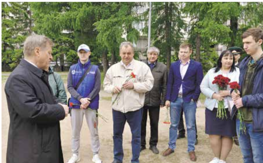
НА ФОТО: ПЕРВЫЙ СЕКРЕТАРЬ НОВОСИБИРСКОГО ОБЛАСТНОГО ОТДЕЛЕНИЯ КПРФ АНАТОЛИЙ ЛОКОТЬ ОБРАТИЛСЯ К КОММУНИСТАМ ПЕРЕД ВОЗЛОЖЕНИЕМ