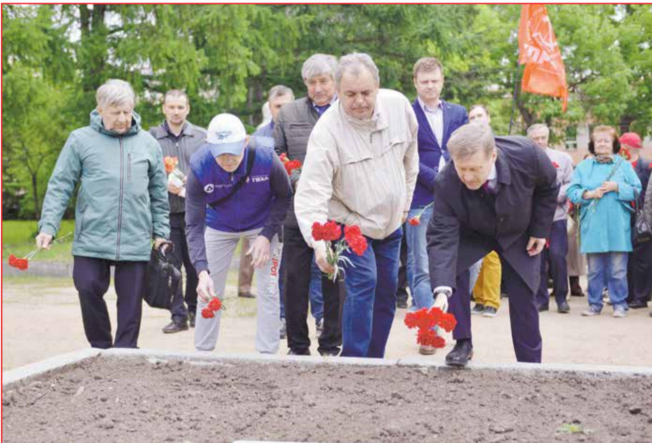
НА ФОТО: ЛИДЕРЫ НОВОСИБИРСКОГО ОБКОМА КПРФ ВОЗЛОЖИЛИ ЦВЕТЫ К МЕМОРИАЛЬНОЙ ПЛИТЕ «ПОСЛЕДНЕГО КОММУНАРА» АДРИЕНА ЛЕЖЕНА