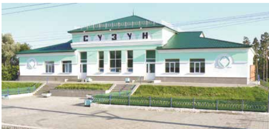
НА ФОТО: КОММУНИСТАМ СУЗУНА НЕ ДАЛИ СПОКОЙНО ПОЧТИТЬ ПАМЯТЬ СОВЕТСКИХ СОЛДАТ